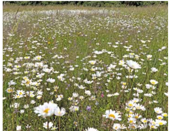
Margeritenblüte im Naturpark Altmühltal.

beispielsweise das gemähte Gras mit den in ihm enthaltenen Samen zur Begrünung nahegelegener Flächen verwenden. Auf diese Weise können artenreiche Wiesen mit naturraumtreuem Saatgut neu entstehen oder renaturiert werden. Herkunftsgesichertes Saatgut vom Saatguthersteller wie z. B. Regiosaatgut ist aufgrund der hohen Nachfrage und der anspruchsvollen Produktion oft nur schwer oder nicht immer in der gewünschten Artenzusammensetzung zu bekommen. Zudem ist im Naturraum gewonnenes Saatgut insbesondere für naturschutzfachliche Begrünungen besser geeignet. Das sogenannte Spenderflächenkataster, d. h. die Zusammenschau von geeigneten und beernteten Spenderflächen sowie entsprechend neuangelegten oder aufgewerteten Flächen, soll künftig bayernweit bei den Unteren Naturschutzbehörden, den Landschaftspflegeverbänden oder den Naturparks geführt und verwaltet werden. Für die Bearbeitung konnte das renommierte Fachbüro Baader Konzept aus Gunzenhausen gewonnen werden. Die Bestandsaufnahme wird in den Monaten Mai/Juni erfolgen, wenn die Wiesen in voller Blüte stehen. Für Rückfragen kann man sich gerne an verein@naturpark-almuehltal.org wenden.